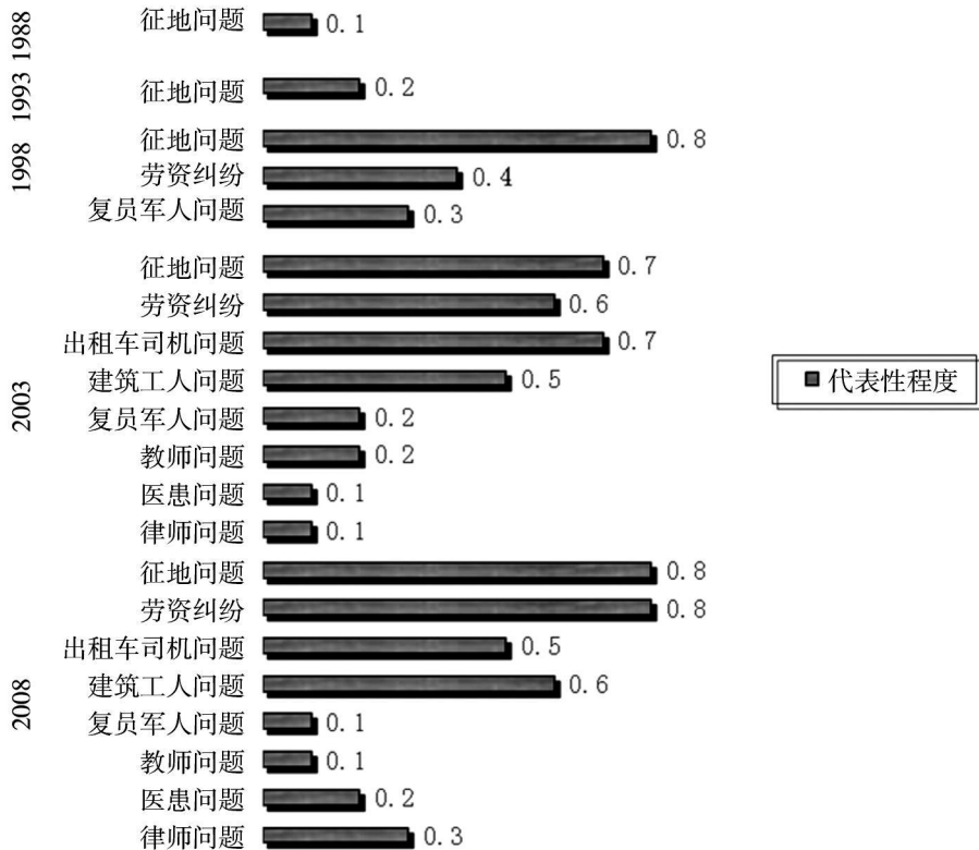
图 1 Z 市社会稳定问题演变图

上述这些社会稳定问题最早出现的时间为 80 年代后期, 我们以 1988 年为基点, 通过下图来说明 Z 市社会稳定问题的出现时间和在不同时期里的代表性程度 ① :